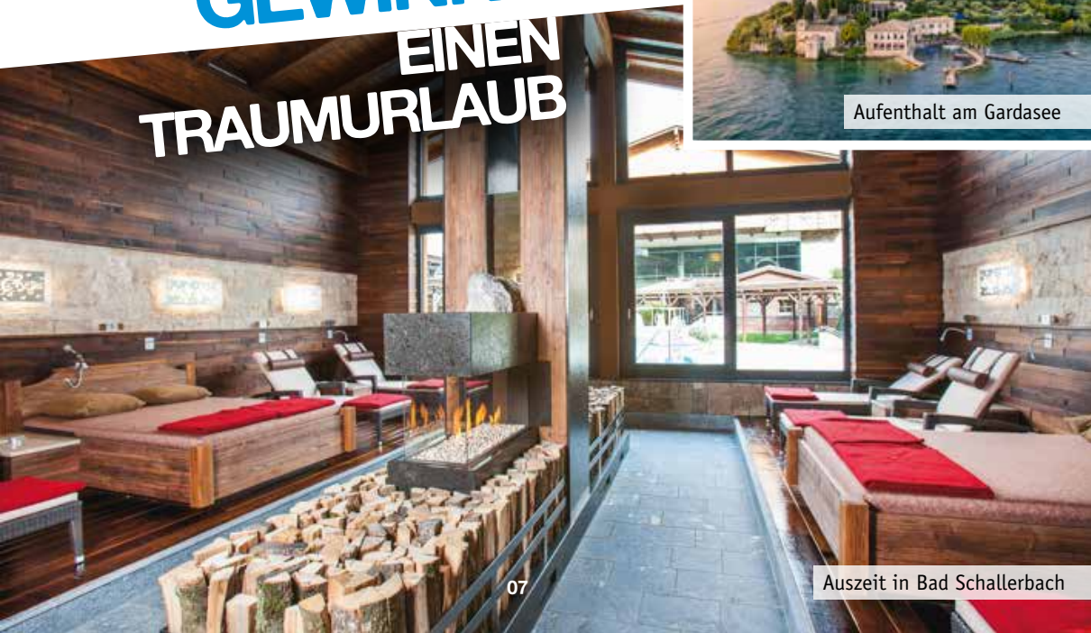
Auszeit in Bad Schallerbach