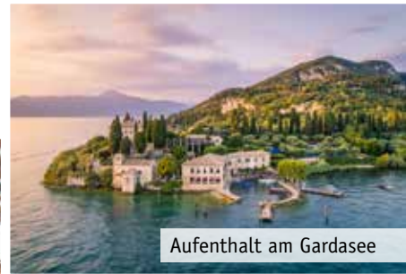
Aufenthalt am Gardasee